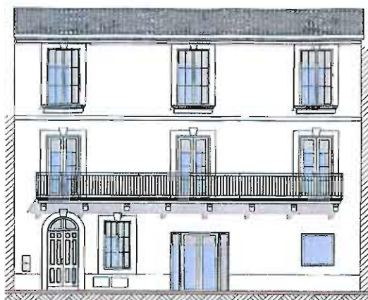
6, Place Roger Salengro

sera livré à l'été 2010. La maison située porte neuve fera l'objet d'une réhabilitation fin 2010 et un programme de réhabilitation de l'immeuble situé rue derrière les murs est en cours d'examen. Afin d'assurer la qualité de l'accueil des habitants et améliorer les conditions de travail des agents administratifs municipaux, le secrétariat a été entièrement rénové l'année dernière. A noter que ce dernier n'avait jamais fait l'objet de travaux depuis plus de 25 ans.